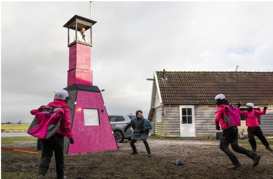
Collectief Absoluut - Winterkaravaan

Dat betekent een gemiddelde donatie van € 8.264 (2023: € 8.113). Daarmee lijkt definitief een eind te zijn gekomen aan de opgaande lijn van eerdere jaren (2022: 9.130, 2021: € 8.746, 2020: €8.433, 2019: € 8.384).