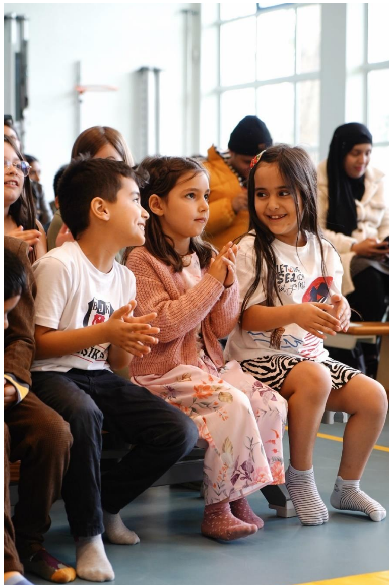
Free as a Songbird

Sommige van deze donaties werden verstrekt in het kader van een samenwerkingsprogramma van fondsen rond armoede en een samenwerkingsprogramma rond veilig en gezond opgroeien.