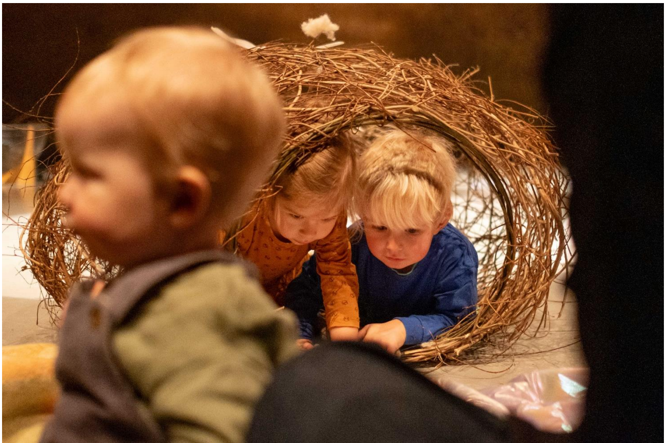
GP Vlechtwerk – Profound Play

Het beeld van 2021 werd overigens sterk beïnvloed door de eerste toewijzingen via het Snelloket Jonge Makers. In dat pilotjaar werden de Snelloket-donaties om administratieve redenen nog niet apart geteld maar als één donatie meegenomen. Gecorrigeerd voor dat effect was de gemiddelde donatie in 2021 € 7.792 en dat lag veel meer in lijn met het gemiddelde in eerdere jaren. Het grotere aantal Snelloket-donaties nadien, met een maximum van € 4.000 per aanvraag, zal het gemiddelde van de afgelopen jaren onder de trendlijn gedrukt hebben.